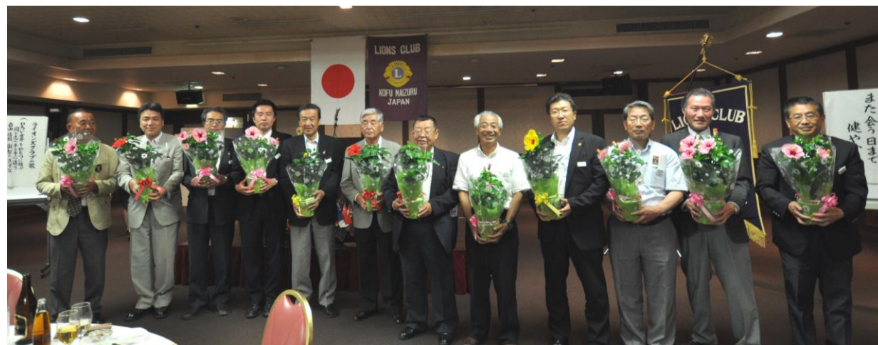
【ライオンナイトにて 皆出席者へ記念品贈呈】

1 年間、甲府舞鶴クラブメンバーの方々、河西会長そして荻原会計よろしくお願ひ申し上げます