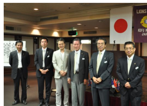
【6月27日 ライオンナイトにて】

今年はクラブ運営の充実を図り、新入会員の増強目標を5名としております。10R-1Zの各目標が3名でしたので、当クラブとしては高い目標を掲げております。また、他クラブ運営の損益分岐点はだいぶ低くなっている様です。会長テーマの『心が通じる、あたたかい奉仕』は、金銭・物品ではなく、奉仕の原点に立ち戻り、心の通じる愛のこもった労働奉仕を充実させる事だと思っております。力不足とは思いますが、皆様のご指導とご協力をいただきながら会長を助け、一年間頑張ってまいりますので、よろしくお願い致します。